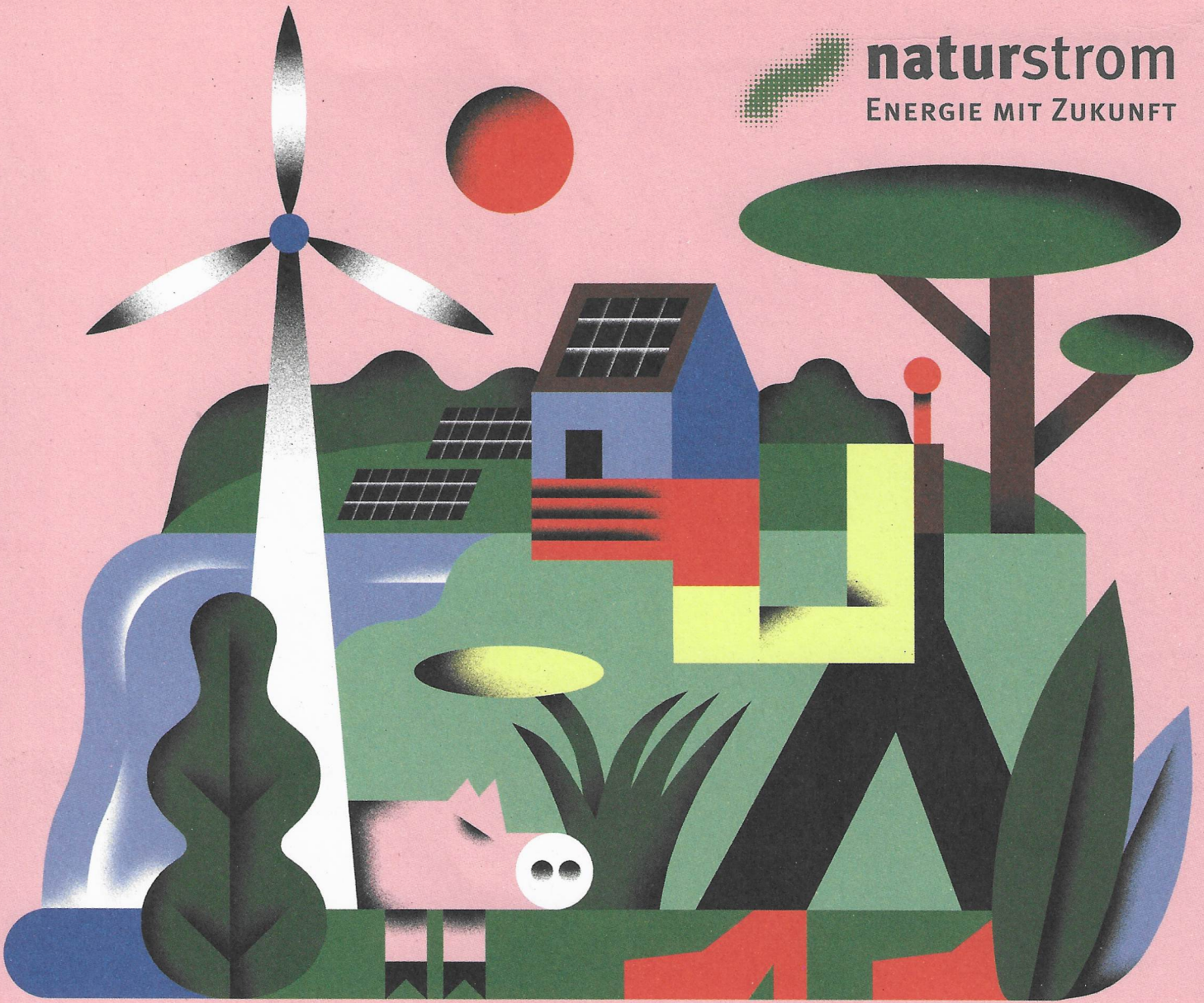
Illustration: ZEBU, Berlin